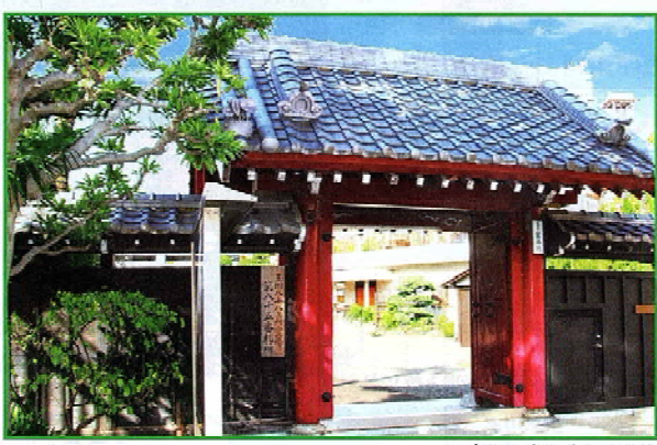
赤門で親しまれる山門

懐かしい下町の風情と多摩川の開放感につつまれる大田区仲六郷に地域の名刹に護られる安心とモダンなデザインを兼ね備えた墓所が誕生しました。